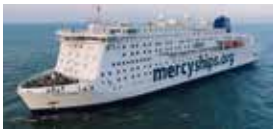
El Global Mercy