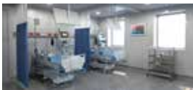
UCI/Sala de recuperación