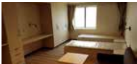
Cabina de tripulación de 2 camas